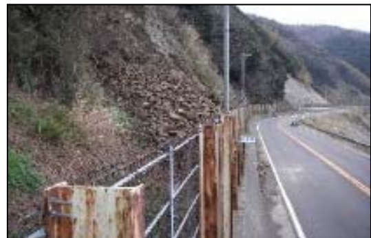
写真② 斜面崩落箇所