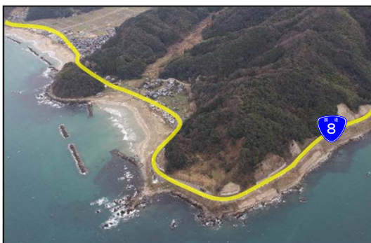
写真① 現道沿いの急峻な地形