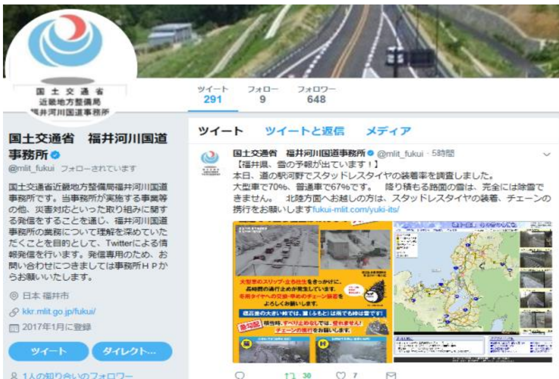
※福井河川国道事務所におけるツイート