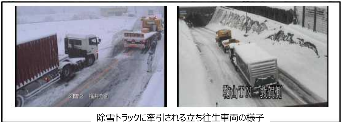
除雪トラックに牽引される立ち往生車両の様子 (平成27年2月10日)

現地において、除雪車の先導走行のほか、一時的な通行止めによる一般車両へのタイヤチェックや経路案内誘導、スタック車両の救出等の訓練を行います。