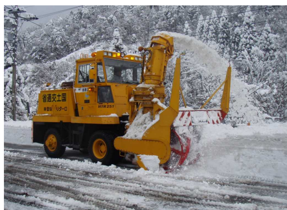
ロータリー除雪車