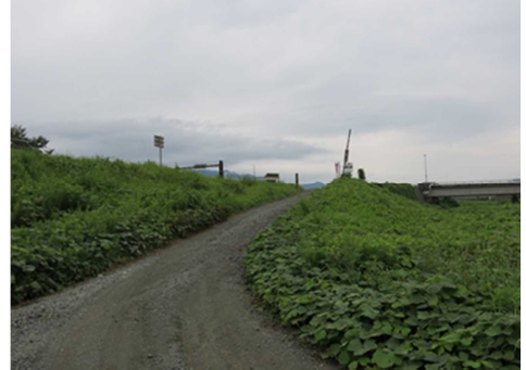
福松橋から下流を望む