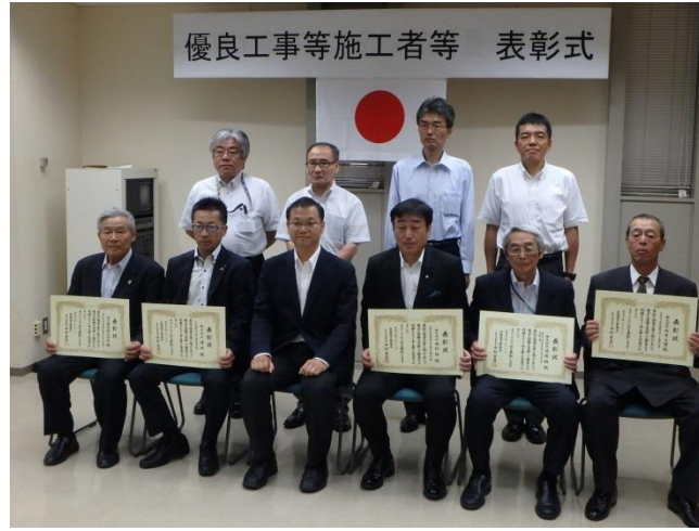
優良工事等施工者(工事)受賞者