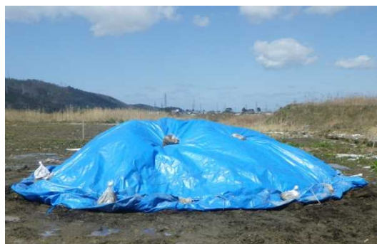
③ブルーシートによる養生