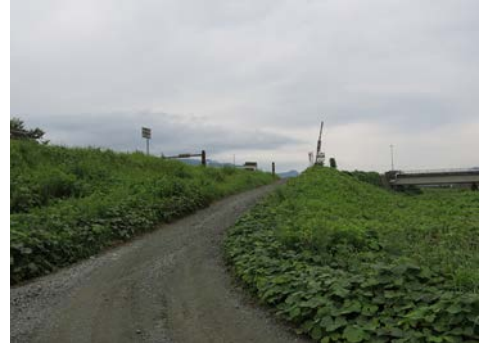
福松橋から下流を望む