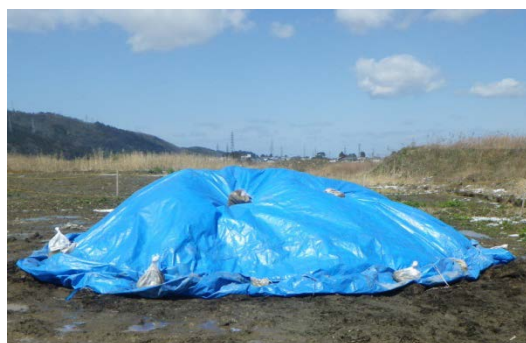
③ブルーシートによる養生