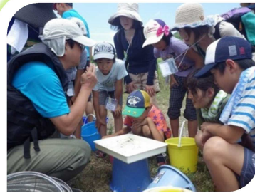
見つかったのは誰かな？