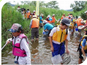
生物はどこにいるかな？

川の生き物に触れたり、身近な川の水質などを知ることができるまたとない機会です。ぜひご参加ください。