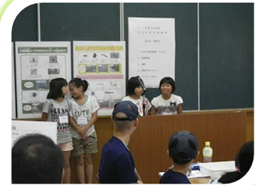
わかったことを発表しよう！