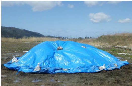
③ブルーシートによる養生