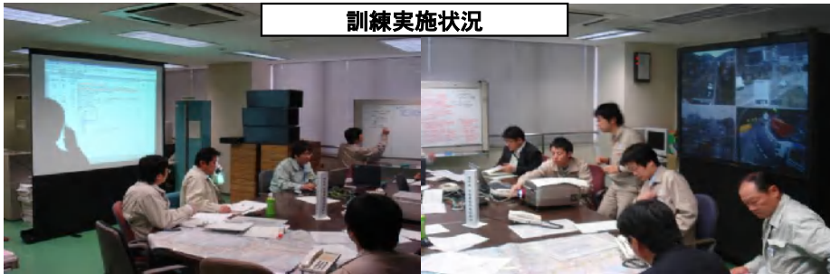
平成18年豪雪ピーク時の事象例をベースに訓練を実施。(H18.12.5)