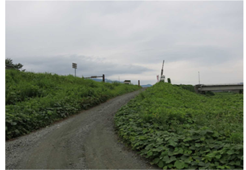
福松橋から下流を望む