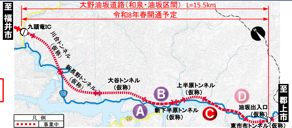
大野油坂道路（和泉・油坂区間）工事状況

※表示は本線部分の進捗を表したものです ※模式図のため現場状況と一致しない場合があります